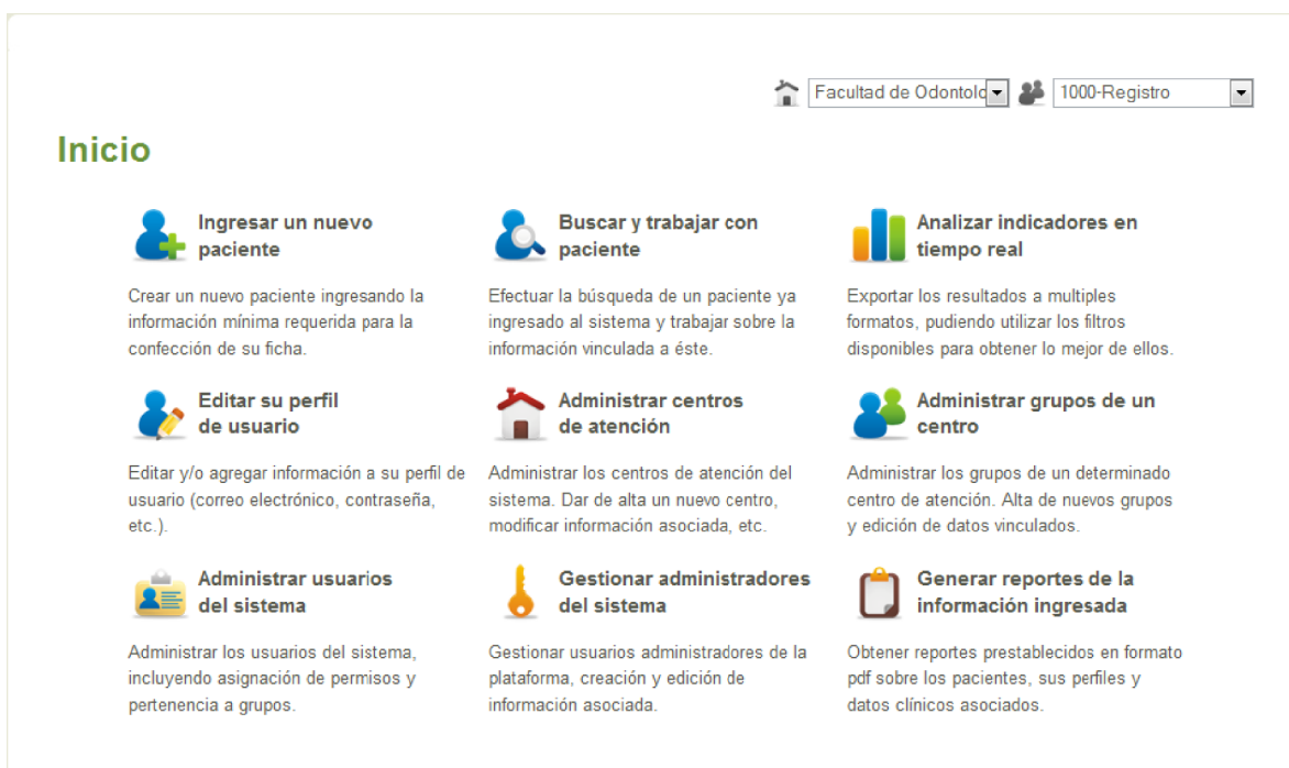
Figura 3 – Menú de inicio de la aplicación web REDIENTE. Notar las funciones habituales para gestionar el ingreso de datos clínicos junto con asignaciones de usuarios y centros de atención. El generador de informes agrupa indicadores sobre poblaciones seleccionadas, con fines epidemiológicos, de control de calidad y de seguimiento docente.